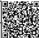
致癌芳香胺清单附表